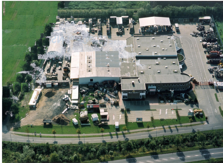
Abb.: Baulicher Bestand 2006

Alle Darstellungen des Umweltberichtes beziehen sich auf den Zustand des Plangebietes im Jahr 2006.