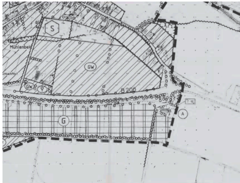
Abb.: Ausschnitt Landschaftsplan „Entwicklung“

Der Landschaftsplan stellt für das Plangebiet Gewerbeflächen dar. Entlang der Straße Neuer Kamp sind Baumpflanzungen dargestellt. Die Planung entspricht den Zielen des Landschaftsplanes.